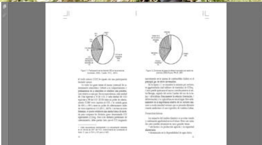
Figura 1. Participación de los distintos GEI en las emisiones mundiales (2004). Fuente PICC, 2007). Tomado de Honty (2011)

No todos los gases tienen el mismo potencial de calentamiento atmosférico. Debido a su comportamiento y permanencia en la atmósfera se establece una ponderación relativa a cada gas. En esa equivalencia, cada unidad de CH 4 equivale a 25 de CO 2 , y cada unidad de N 2 O equivale a 298 de CO 2 . El SF 6 tiene un poder de calentamiento 22.800 veces superior al CO 2 y la variada gama de KFCs y PFCs tiene un poder de calentamiento miles de veces superior al CO 2 (PICC, 2007). Con base en estas fórmulas, se puede establecer una unidad única de medida para comparar los distintos gases denominada CO 2 equivalente (CO 2 eq). Pese a los distintos potenciales de calentamiento, debe quedar claro que el CO 2 (originado mayormente en la quema de combustibles fósiles) es el principal gas de efecto invernadero (Honty, 2011).